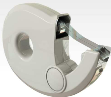
Aplikátor bezpečnostní pásy