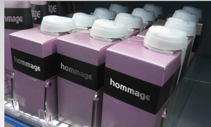
Parfémy & kosmetika