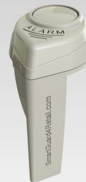
Připravený k použití